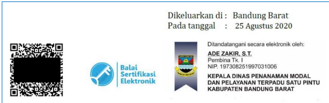
Gambar 3. Contoh tanda tangan digital pada warkah