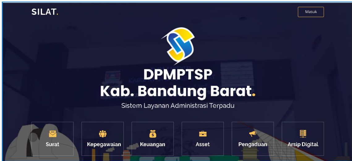
Gambar 2. Aplikasi SILAT