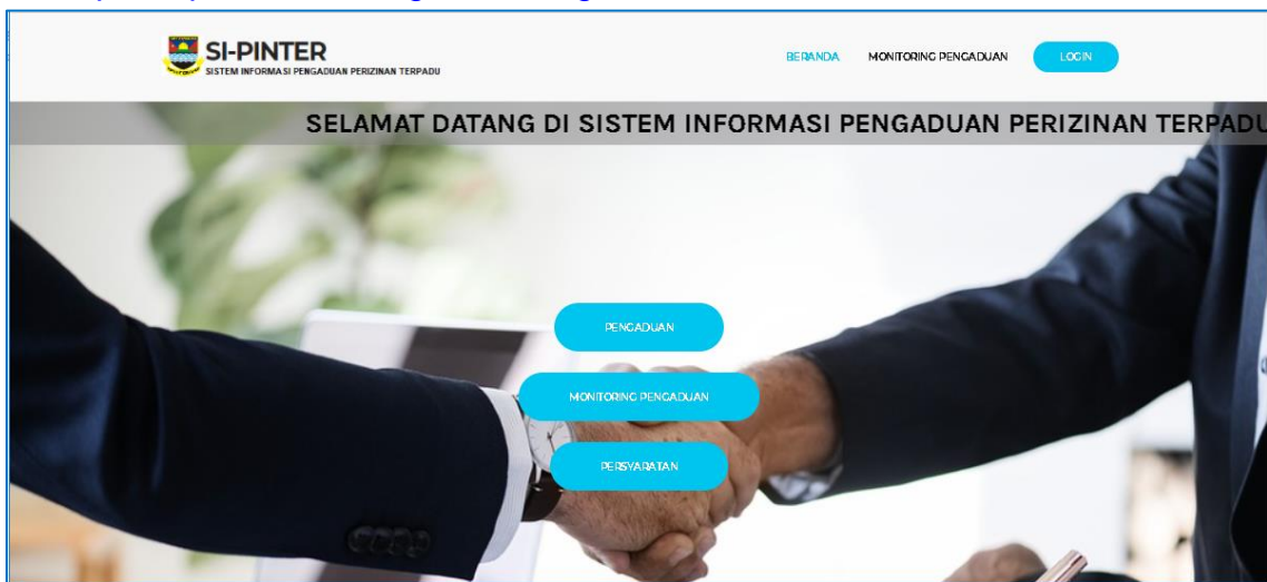
Gambar 1. Aplikasi SIPINTER